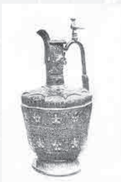
شکل ۵- تنگ برنجی نقره‌کاری شده عهد سلجوقی (هنر اسلامی)

خود، اعجاز می‌نمود. خواجه غیاث‌الدین به سبب شخصیت ممتاز، ثروت و دارایی بی‌شمار و هنر خود در شمار درباریان شاه عباس قرار گرفت. آگذرچه این هنرمند در زمان خود، آثار بسیاری خلق کرد اما اکنون بیش از ۸ قطعه از آثار وی باقی نمانده است. در تصاویر پارچه‌های وی، سبک و اسلوب نقاشی رضا عباسی نمایان است و موضوعات تزئینی از قبیل گل، بوته و ... در آثار وی کامل‌تر و دقیق‌تر مشاهده می‌شود. ابتکارات خواجه غیاث‌الدین دو بعدی بود. برخی از طرح‌ها را شخصاً طراحی و روی پارچه پیاده می‌شد