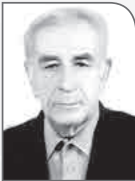
تهیه و تنظیم: مهندس اکبر شیرزاده