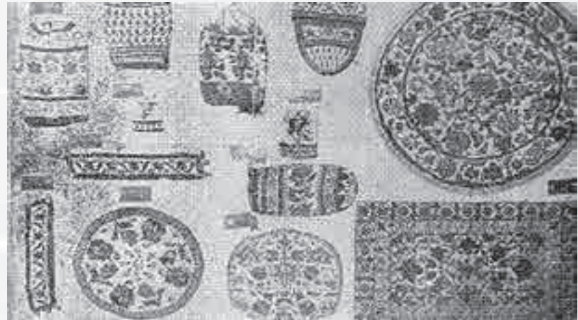
شکل ۴- نمونه‌هایی از منجوق‌دوزی که در تالار شماره ۳ موزه هنرهای تزئینی موجود هستند.

نقش بته‌جقه در زمان گذشته و امروز کاربرد زیادی دارد که می‌توان در تولیدات فلزی روی چایخوری‌های نقره قلمزنی شده و یا روی بشقاب‌های مسی قلمزنی شده مشاهده کرد، یا روی زمینه‌های ترمه به‌صورت ملبله‌کاری شکل بته‌جقه، دست‌دوزی و تکه‌دوزی شده است، یا روی منسوجات قالی‌ها، نقوش ظروف و ... این کاربردها به کرات و در تمام دوره‌ها نشانه آن است که سرو و به طور کلی درختان در جوامع ایرانی از قدیم‌الایام، قداست و احترام خاصی داشته است. البته گاهی بته جقه‌ها طرح‌های ساده و گاه دارای ظرافت و ریزه‌کاری‌های بسیاری بوده‌اند و در نهایت به کثرت فرم بته‌جقه برخورد می‌کنیم که در هر دوره با ظرافت خاص آن زمان و یا سلیقه‌های هنرمندان آن روزگار طراحی می‌شدند و بته جقه‌ها را با آرایش خاصی روی ترمه پیاده می‌کردند. بعضی اوقات نیز به صورت موازی، برخی به صورت مورب و گاهی به‌صورت ضربدری و قرینه‌سازی؛ هنگامی هم به‌صورت بزرگ و کوچک در دل یکدیگر قرار می‌گرفتند و طرح‌های بدیع و چشم‌نواز خلق می‌شد که همگی نشان‌دهنده نظم و ترتیب بود.