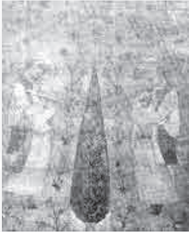
شکل ۲- سجاده ترمه بته‌جقه زمینه زرد- سده ۱۱ هجری

زمان سلجوقیان و صفویه، تحولات زیادی در ترمه ایجاد شد که در سیر تکامل طراحی در ایران را با ذکر شرح حالی از «غیاث‌الدین یزدی» بررسی می‌کنیم.